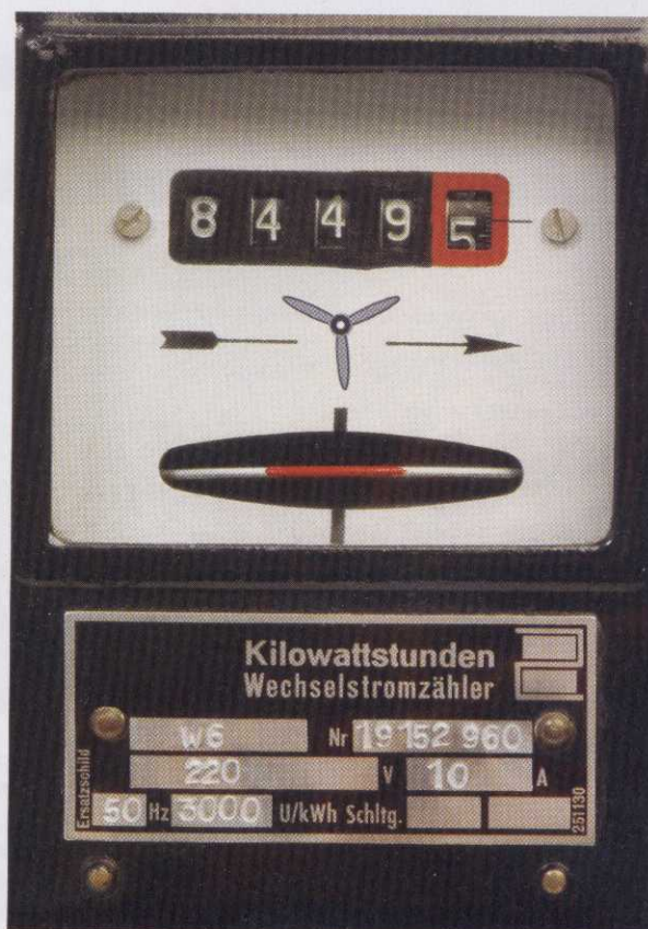
GRÜNER MÜHLENANTRIEB: Bislang nutzen nur wenige Windmüller Grünstrom für den Eigenstrombedarf ihrer Turbine.

Heute versorgt Naturstrom rund 150 Megawatt Windleistung